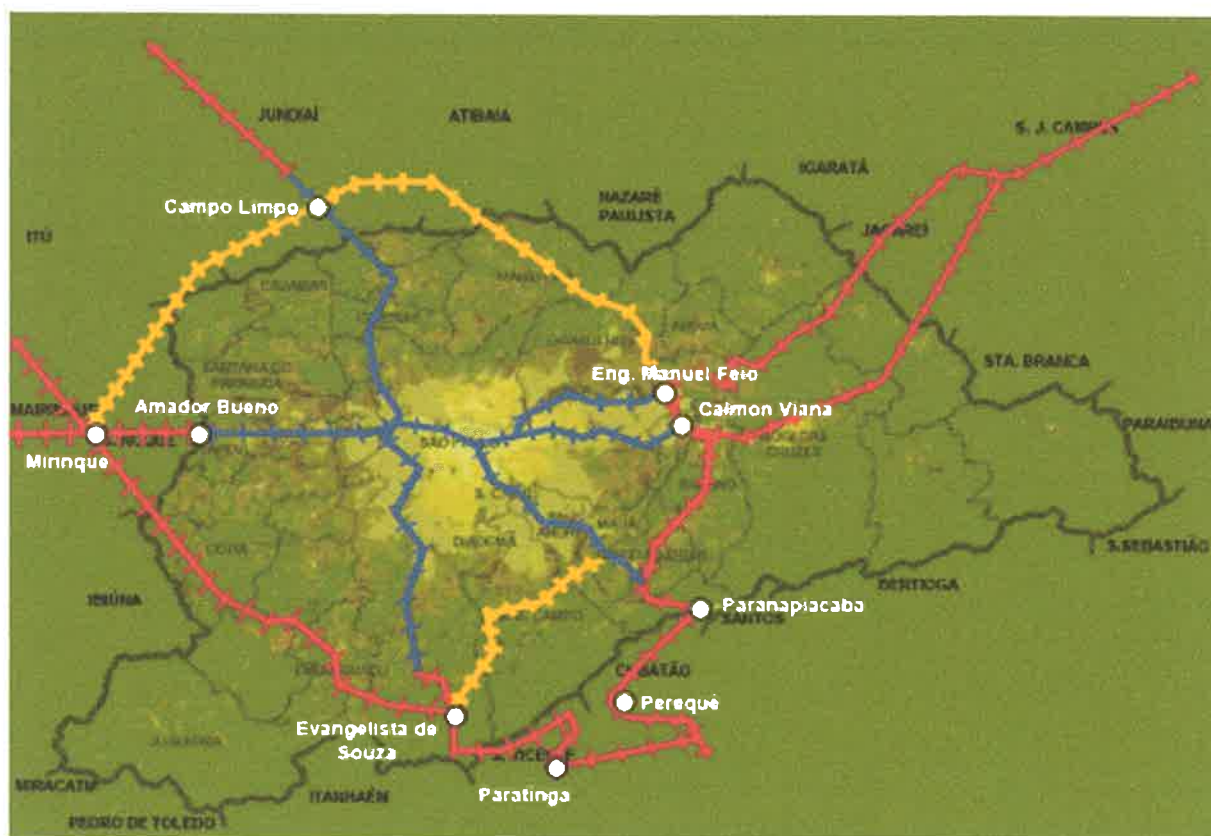
figura5 – Ferroanel

2.47 - Universidade Pública que contenha cursos de acordo com a vocação e realidade da região ex. meio ambiente , turismo , agricultura , agrimensura , planejamento urbano , regional e geologia , com campus espalhados principalmente nos municípios mais afetados economicamente ( Embu Guaçu , Itapeccica da Serra , São Lourenço e Juquitiba ) , com laboratórios de análise do solo e agua .